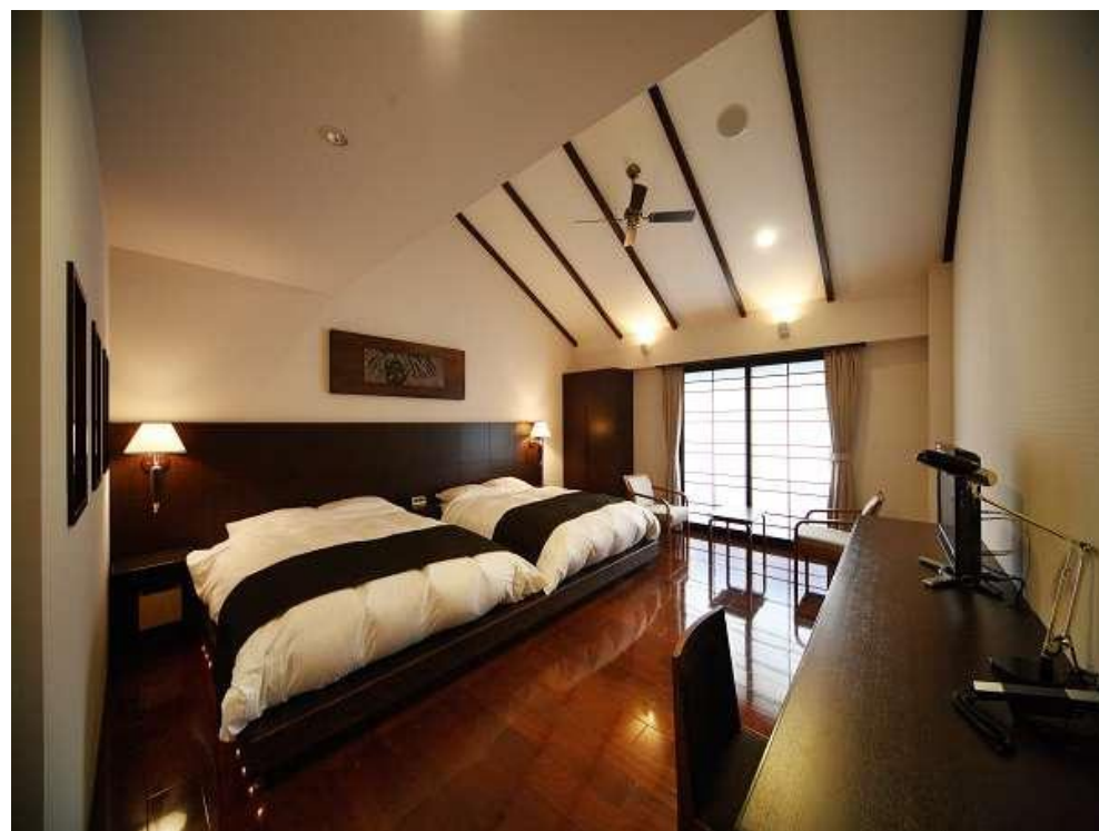
内温泉付(フラット)