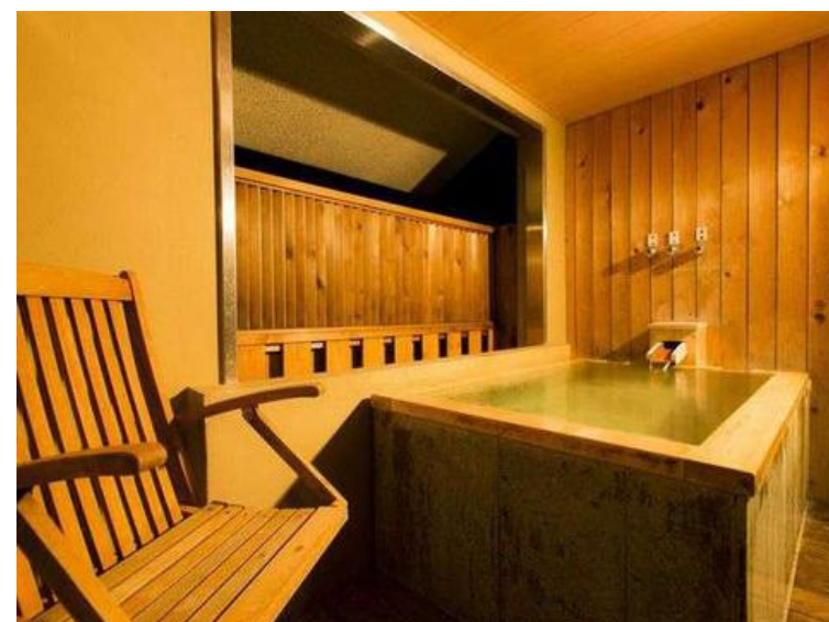
露天風呂(メゾネット)